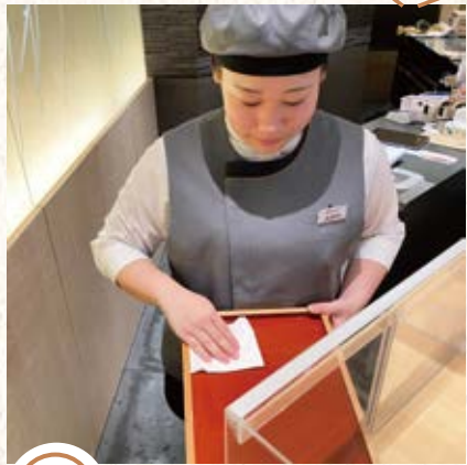
⑬ 次の日のために お店の片付けをし、 1日の業務は終わりです。