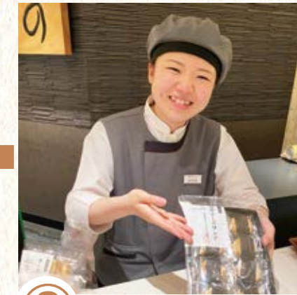
⑧ お客様がまだ知らない、 おいしいお菓子をご紹介します。