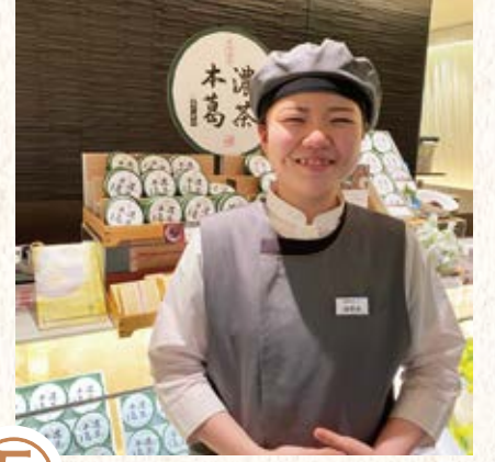
⑤ 開店時間 笑顔と明るい声で お客様をお迎えます。