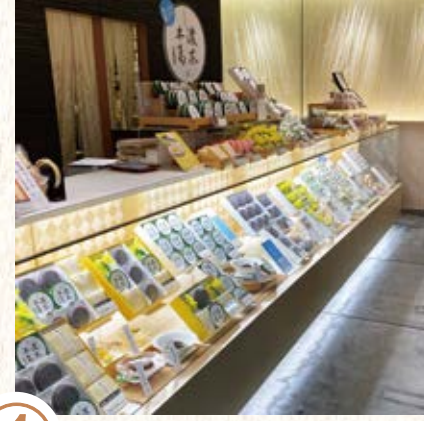
④ 準備が整いました！