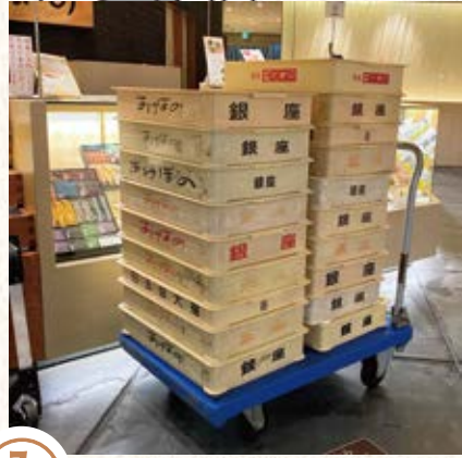
① 開店準備 毎朝、工場から たくさんの商品が納品されます。