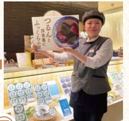
⑦ お客様にいち早く気づき、笑顔とアイ コンタクトで「いらっしゃいませ！」と お迎えます。お客様のお話をよく聴き、 お菓子のご説明やご提案をしながら、 お役に立てるようおもてなしをします。