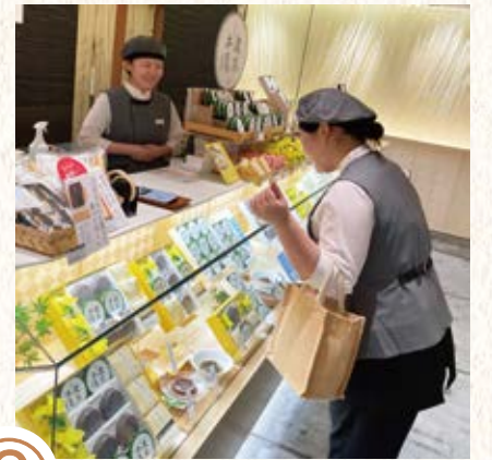
⑥ 遅番で出勤した仲間にも、 笑顔と明るい声であいさつします。