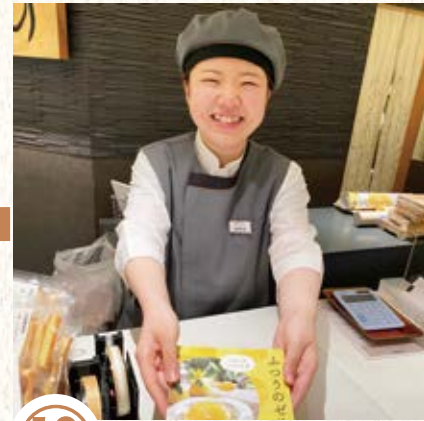
⑩ お見送りの前、お客様に 「またあけぼのに來たいな」 と思っていただけるよう、 期間限定や数量限定の お菓子のご案内をします。