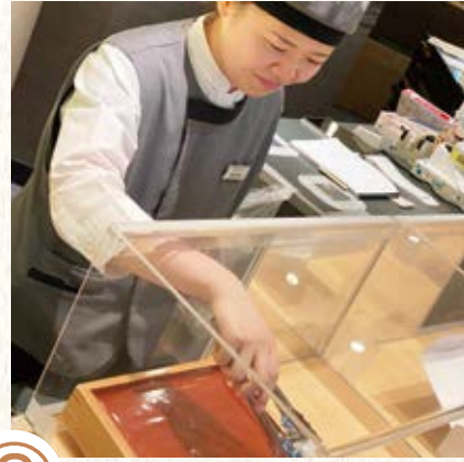
② 早番は商品を検品をして、店頭にならべます。 お菓子が美味しそうに見える様、ひとつずつ心をこめて…。